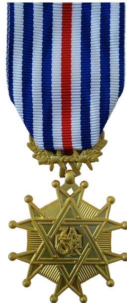
Médaille d'Or et Grand'Or