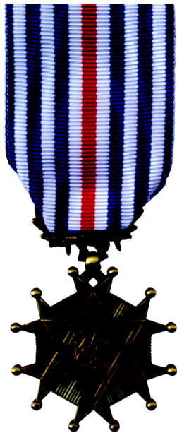
Médaille de Bronze