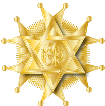
Grande Cravate d'Or